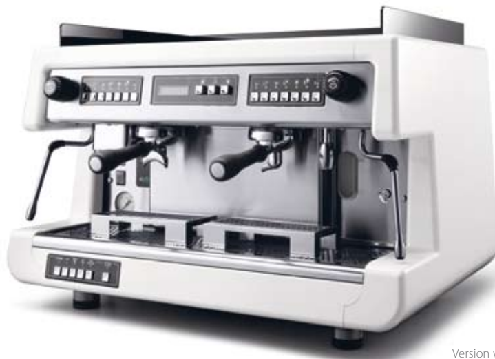
Version with display, LCL LatteCaffèLatte and raised groups